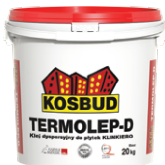
Дисперсионный клей для плиток KLINKIERO TERMOLEP-D