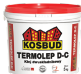
Двухкомпонентный клей TERMOLEP D-C