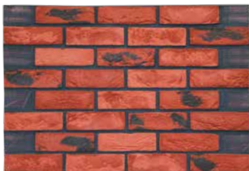
ЭЛАСТИЧНАЯ ПАНЕЛЬ KLINKIERO

CATEDRO - 210 мм x 65 мм; 60 штук в упаковке ROMA - 240 мм x 65 мм; 52 штуки в упаковке