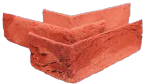
ОТДЕЛЬНЫЕ УГЛОВЫЕ ПЛИТКИ