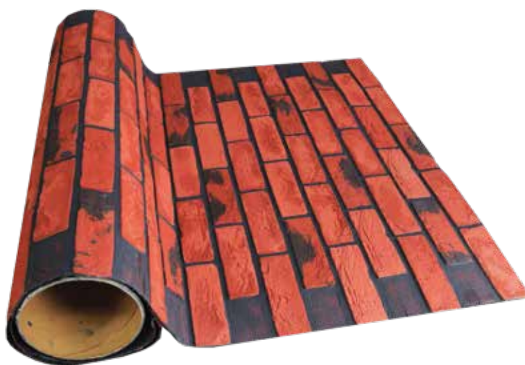
ЭЛАСТИЧНАЯ ПАНЕЛЬ KLINKIERO- РУЛОН

CATEDRO - 890 мм x 610 мм (ок. 0,54 м 2 ); 7 штук в упаковке ROMA - 1010 мм x 610 мм (ок. 0,61 м 2 ); 7 штук в упаковке